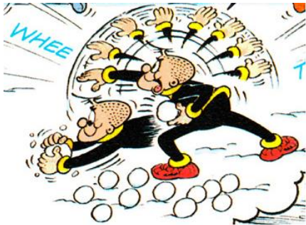
Strip met veel beweging

Je weet hoe beweging vastgelegd kan worden in beeld, zoals o.a. in de fotografie en het futurisme wordt toegepast.