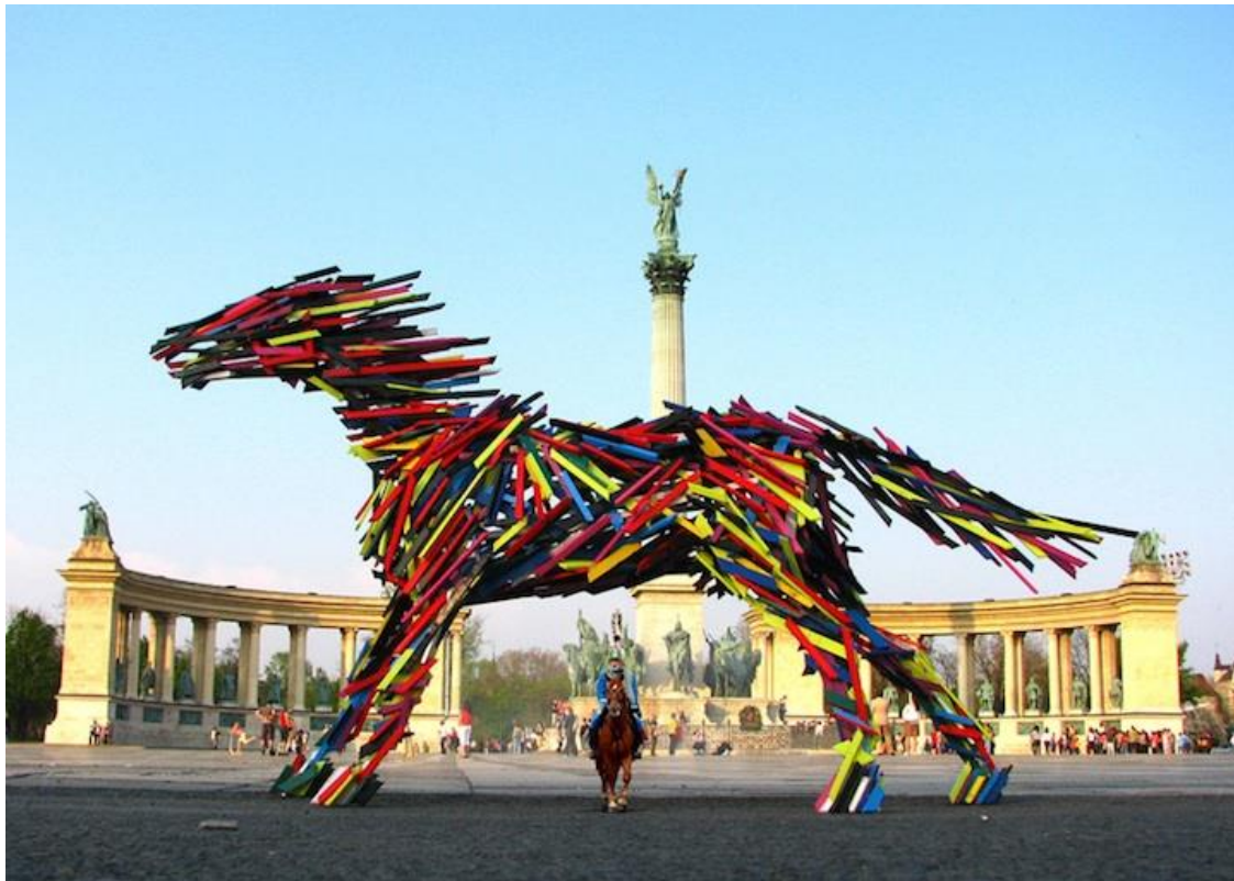
M. Szoke: Rennend paard

Je kent verschillende mogelijkheden om dynamiek en actie in stilstande twee- en driedimensionale werken te verbeelden.