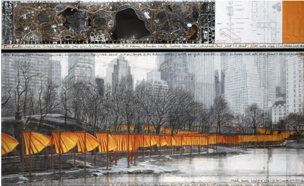
Figuur 2 Christo, Schets voor De poorten (2003).