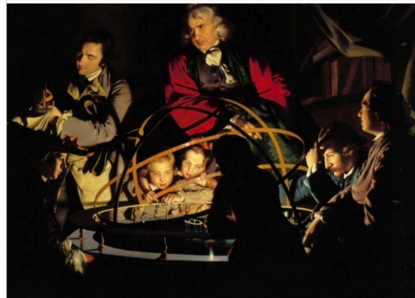
Joseph Wright of Derby, Een wetenschapper geeft een lezing over het zonnestelsel (ca. 1766).