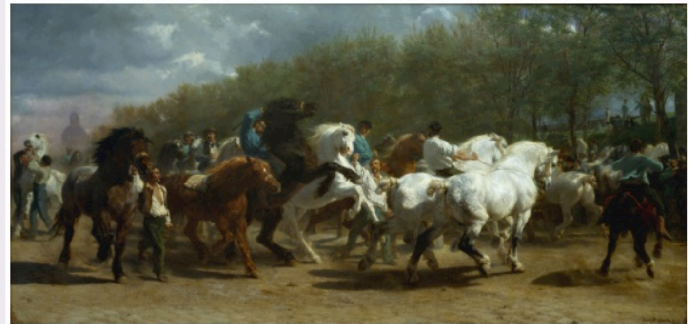
Rosa Bonheur, De paardenmarkt (ca. 1853).

De paardenmarkt is te zien geweest op de Parijse Salon. Ook van Mary Cassatt en Berthe Morisot is af en toe werk te zien. Wel is dat werk uit hun vroege periode, waarin zij nog voldoen aan de neoclassicistische eisen. Hun latere werk, waarin zij niet langer in die stijl schilderen, wordt vaak door de conservatieve jury geweigerd.